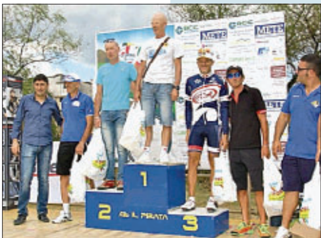
ALCUNI MOMENTI DELLE PREMIAZIONI